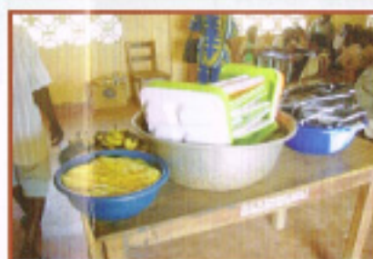
給食が運ばれてきま した