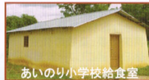
あいのり小学校給食室

日本人に給食をおごっ てもらった子どもたちの 中から、将来日本の大 学等に留学する子どもも きっとでてくる。そんな日 も近い。