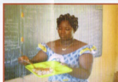
給食のおばさん登 場！！