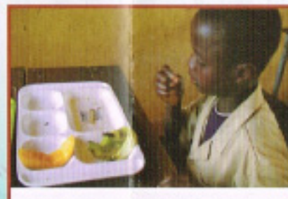
これから毎日給食が 食べれます