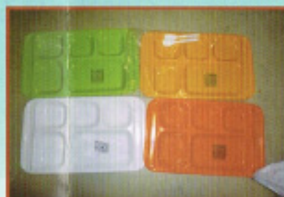
所ジョージさんから 頂いた給食プレート