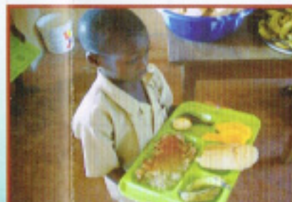
給食を受け取った こども