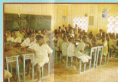
給食を待つ子どもた ち