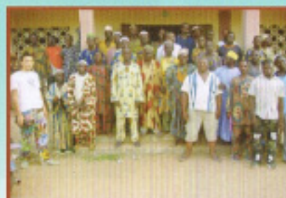
給食を開始するた め集会をした村人