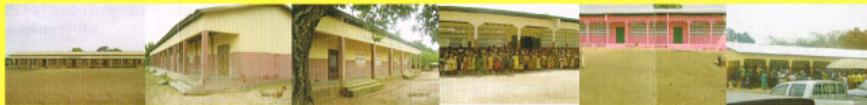
たけし小学校 江戸小学校 明治小学校 いのうえ小学校 あいのり小学校 所ジョージ小学校 2009年5月開始 2009年9月開始 2010年5月開始