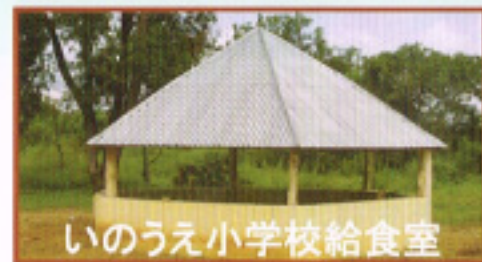
いのうえ小学校給食室