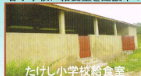
たけし小学校給食室